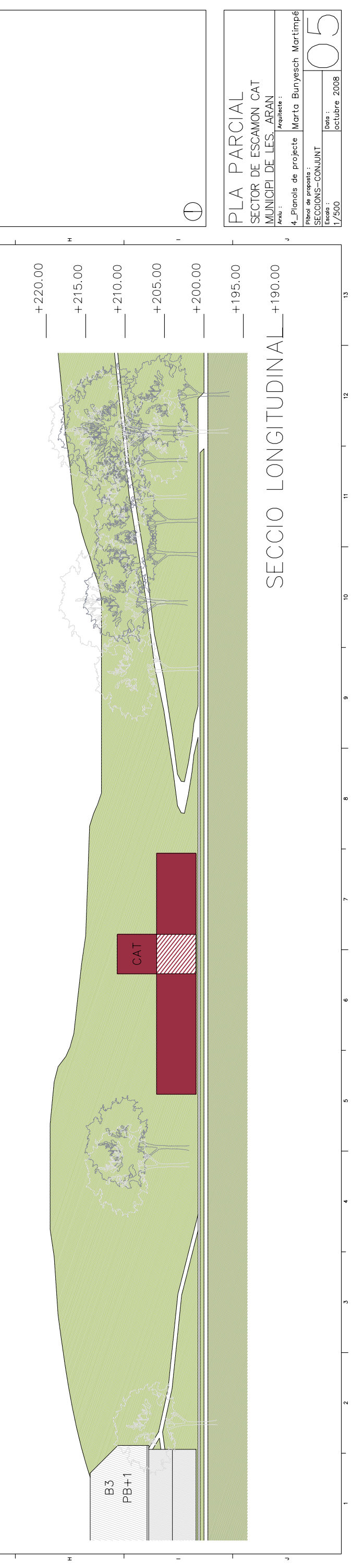
SECCIO LONGITUDINAL +190.00